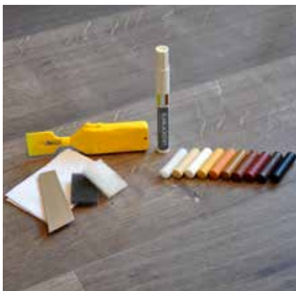
Hartwachs-Reparaturset Artikel-Nr. 1101060150

Für die Reparatur von kleinen Schäden in Bodenoberflächen (z.B. Kratzer, Druckstellen, kleine Löcher).